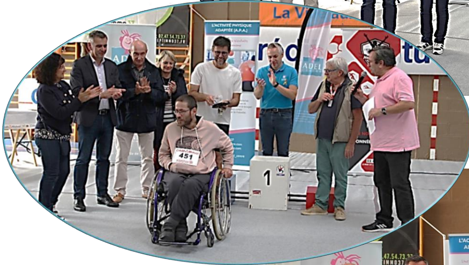
Animation Philippe Chaput