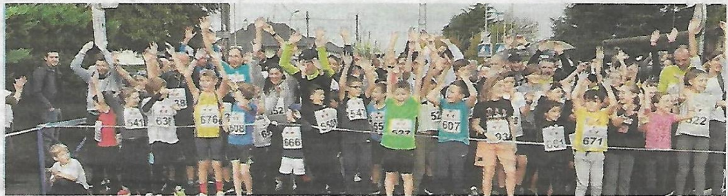
Les 2 km des familles ont été particulièrement joyeux.

Après deux années de disette, n'ayant pu se dérouler à cause de la crise sanitaire, la course solidaire Courir Santé faisait son grand retour dimanche 16 octobre pour l'édition de cette année, qui était aussi celle du 25 e anniversaire. À l'issue de la matinée, les organisateurs et la municipalité pouvaient être soulagés. Certes, les chiffres de participants n'ont pas atteint ceux des éditions précédentes, mais pour une reprise, ils étaient quand même près de 700 (avec le parcours famille) à avoir répondu présent.